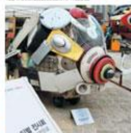
⑬ 매주 토요일 11~16시에 열리는 동진 명물시장. 참가 문의 http://blog.naver.com/neuljang365