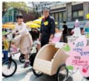
⑤ 두 달에 한 번, 6월 15일(일), 8월 31일(일) 등 12~18시에 열리는 연남동 마을시장 따뜻한 남쪽. 참가 문의 http://www.livingnart.or.kr