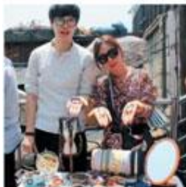
① 매일 마지막 주 토요일 12~18시에 열리는 이태원 계단장. 참가 문의 http://www.facebook.com/wosadan