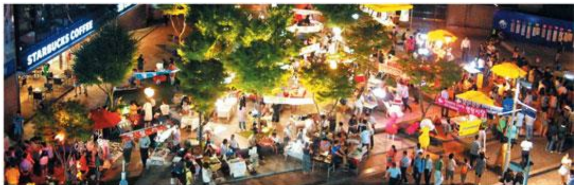
⑬ 매주 11월 7일부터 이듬해까지 매주 금요일 17~21시에 열리는 동진 명물시장. 참가 문의 http://www.bongmart.or.kr