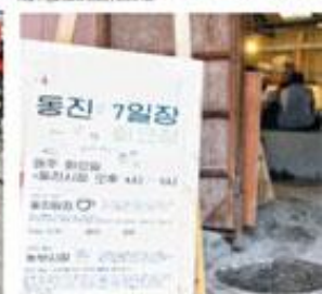
⑬ 매주 토요일 11~16시에 열리는 동진 명물시장. 참가 문의 http://www.facebook.com/makedongjin