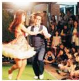
② 매일 마지막 주 금요일 17~21시에 열리는 영등포 달시장. 참가 문의 http://daisi.jang.kr