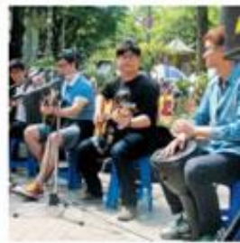
④ 매주 토요일 13~18시에 열리는 홍대 앞 예술시장 프리마켓. 참가 문의 http://www.freemarket.or.kr