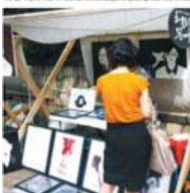
⑩ 매일 셋째주 토요일 14~19시에 열리는 헬로우 문래. 참가 문의 http://www.facebook.com/hellomul