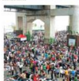
③ 매주 토·일요일 11시~16시 (3월부터 11월 까지)에 열리는 독섬 아름다운 나눔 장터. 참가 문의 http://www.flea1004.com